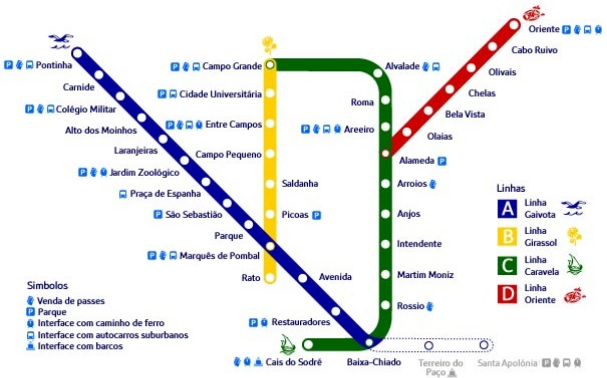
Subway Transportation Network